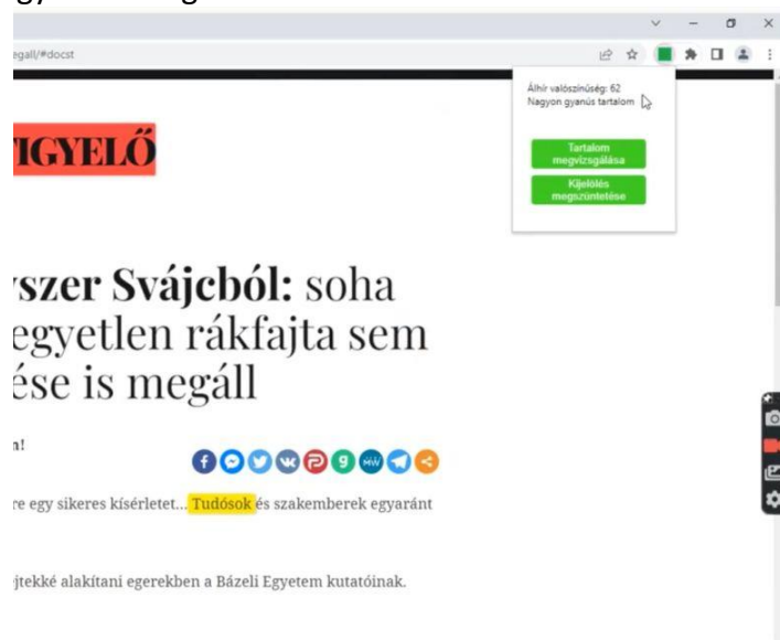
3. Ábra. A keresőprogramba beépülő bővítmény alkalmazás működés közben. Lényegében az okostelefonos alkalmazáshoz hasonló a döntése, de a teljes, az oldalon található szöveg

Készítettünk egy keresőprogramba beépülő álhírdetektáló alkalmazást is. Ennek továbbfejlesztésén még dolgozunk, de az első működőképes változatot bemutató videó elérhető a https://1drv.ms/v/s!AsNC4EZvD52RgUW3j81BxBsXoZHy címen, illetve a https://www.alhirdetektor.hu/Videos vendégoldalról. A 3. ábra illusztrálja a működését. Lényegében hasonló a tudása, mint az okostelefonos alkalmazásunké. Ennek a megoldásnak a kidolgozottsága egyelőre a legkisebb.